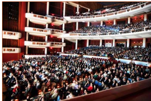
佛罗里达州劳德代尔堡布洛瓦艺术表演中心，观众被神韵演出吸引。

演出，包括当地政要、艺术家在内的各界观众为神韵呈现的壮丽辉煌的五千年神传文化之美而震撼。