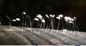
2008 年 5 月 15 日，湖北省武穴市一法轮功学员家里桌子上的法轮功创始人像前，一盛水的塑料茶杯上，突然发现开出了 30 多朵优昙婆罗花。

大福德力故，感得此花现。”就是说，这种“优昙婆罗花”每三千年开一次(今年按佛记是 3035 年)，当花开的时候，意味着将有转轮圣王在人间正法。