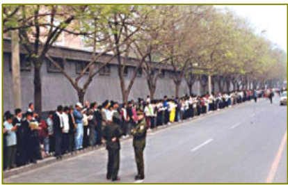
法轮功学员文明安静，警察不用维持秩序，在一旁聊天。学员背后不是中南海红墙，所谓的“围攻中南海”根本不存在。

2001年中国新年前的除夕夜，在北京天安门广场，中共用谎言编造了“天安门自焚”伪案，想用“火烧”活人的惨剧，栽赃、陷害法轮功，为进一步迫害法轮功找借口。但是假的就是假