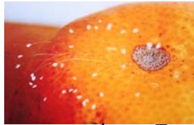
2008 年 11 月，湖南省辰溪县一法轮功学员的柑橘树结的一个桔子和一个橙子上开了多朵优昙婆罗花。