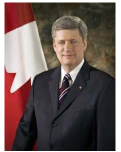
加拿大总理蒂芬·哈珀