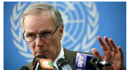
联合国特派专员菲利普·奥尔斯顿先生（Mr. Philip Alston）在联合国总部的新闻发布会上

联合国特派专员菲利普·奥尔斯顿先生（Mr. Philip Alston）在最新发表的全球报告中，特别提出法轮功学员在中国被关押期间遭酷刑致死的严重情况。他呼吁中国政府：“必须对所有不经过正式起诉的非法任意处决的可疑案件进行彻底、迅速且公正的调查，包括亲属的投诉及在上述情况认定为非自然死亡的其它可靠的报告。”