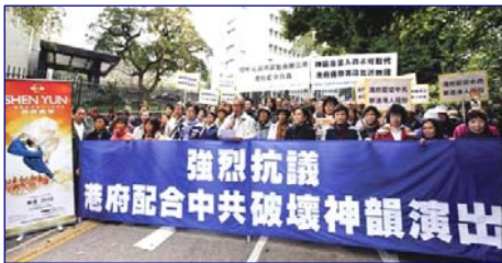
香港各界一月二十六日集会游行抗议港府胁停神韵演出

神韵巡回艺术团团长李维娜指出，港府被中共操控，破坏了这次演出。但她强调，神韵在未来肯定会去香港演出，只