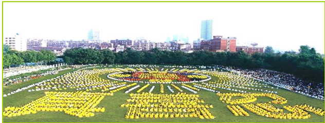
1997 年武汉 5000 多名法轮功学员炼功，排组法轮图形和“真善忍”字样。

泰国著名爱国华侨泰亿利有限公司总经理钟奕江先生，原患有视网膜黄斑病变，是中西医都棘手的不治之症，李老师曾破例为其调治，让他闭眼后，几分钟内高功能治疗，一次彻底治愈，没收分文报酬。一九九九年十月一日中国北京国庆大典时，钟先生是天安门观礼台的海外来宾之一，当国家安全部官员向他询问法轮功之事，他