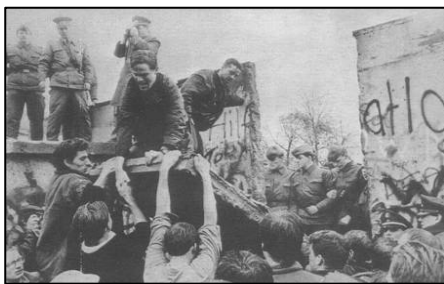
1989年11月柏林墙被拆除的瞬间

故事发生在柏林墙倒塌之后的德国。一九九二年二月，统一后的柏林法庭上，举世瞩目的柏林围墙守卫案将要开庭宣判。这次接受审判的是四个年轻人，都三十岁不到，他们曾经是柏林墙的东德守卫。