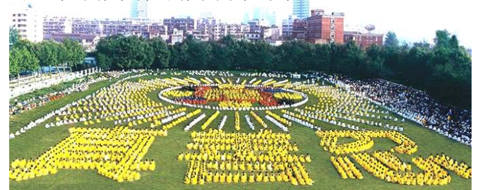
■图为一九九七年，湖北武汉，五千多名法轮功学员集体炼功，排组法轮图形和“真善忍”字样的场面。