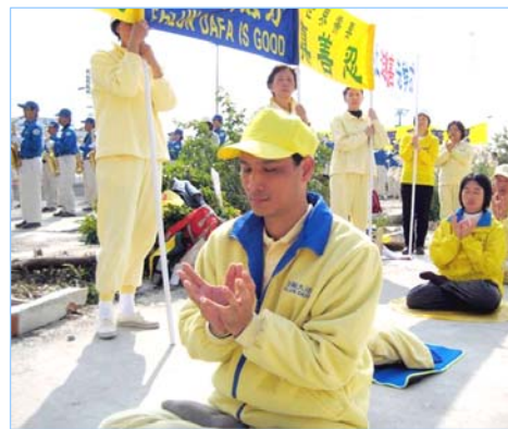
游住盟参加集体炼功讲真相活动

对于如何把握做生意的心态，游住盟在《转法轮》中读到：“不怕你当多大官，也不怕你有多大的财，关键是你能不能把那颗心放下。”“你搞个体经营、开公司，做什么生意都没关系，公平交易，把心摆正。人类社会各行业都是应该存在的，是人的心不正，而不在于干什么职业。”游住盟有所体会：只要秉持“真善忍”，堂堂正正诚信做生意，就可符合修炼人的标准。于是他在大哥朋友的协助