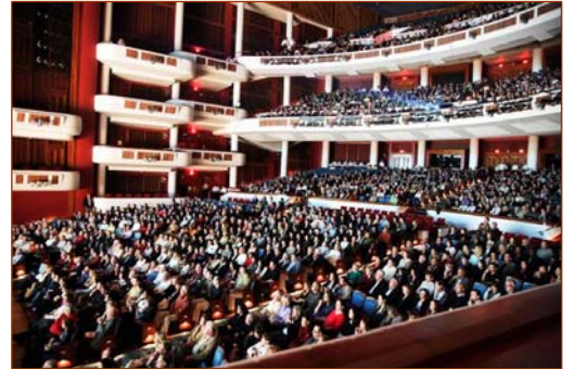
佛罗里达州劳德代尔堡布洛瓦艺术表演中心, 观众被神韵演出吸引。

演出, 包括当地政要、艺术家在内的各界观众为神韵呈现的壮丽辉煌的五千年神传文化之美而震撼。