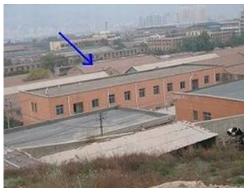
箭头所指为兰州市龚家湾洗脑班