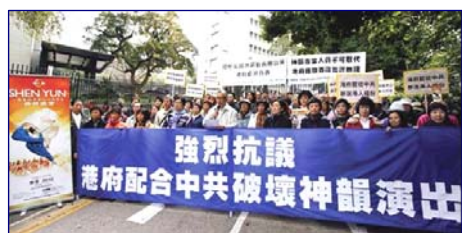
香港各界一月二十六日集会游行抗议港府胁停神韵演出

有一天，妹妹跟我说：“你现在明白修炼吗？”我明白了，修炼不只给我带来精神上的充实，戒掉了赌博，更重要的是：教会了我做人的道理，我知道了为什么活着。