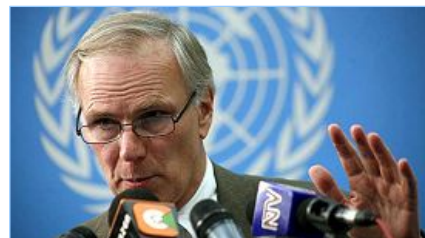
联合国特派专员菲利普·奥尔斯顿先生（Mr. Philip Alston）在联合国总部的新闻发布会上