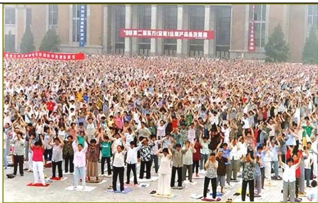
沈阳市法轮功学员辽宁工业展览馆晨炼 (1998)

1998年10月20日，国家体总派到长春和哈尔滨的调研组组长发表讲话说：“我们认为法轮功的功法功效都不错，对于社会的稳定，对于精神文明建设，效果是很显著的。”