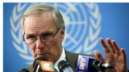
联合国特派专员菲利普·奥尔斯顿先生（Mr. Philip Alston）在联合国总部的新闻发布会上