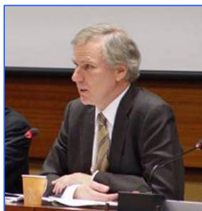
■ 特派专员菲利普-奥尔斯顿先生在日内瓦联合国会议期间聆听证人的发言

【明慧网】中共政权非法任意处死受关押者一直是遭世界谴责的人权犯罪，近年来大批法轮功学员被迫害致死更是引起关注。在联合国特派专员菲利普-奥尔斯顿先生（Mr. Philip Alston）二零零九年提交联合国的年度报告中，法轮功学员被迫害致死问题备受关注。在报告中，菲利普-奥尔斯顿先生列举了他向中国政府征询的二十个案例，其中十六个是法轮功学员被迫害致死的案例。