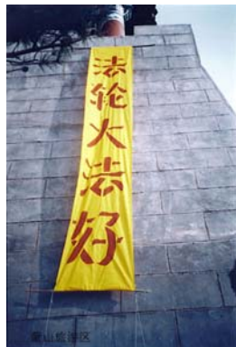
■ 山东沂蒙法轮功学员冒着危险挂在沂蒙山区高楼上的真相标语“法轮大法好”

过了二十天，外甥来我家说：“我爸能吃两个馍、喝一碗汤了，也能走路了。”正月初十那天，我去他家看他，他在院里正看《九评》呢。看他的脸色红润，象没得病似的，他站起身来对我说：“我天天念法轮大法好，真善忍好。我的病真的好了。”