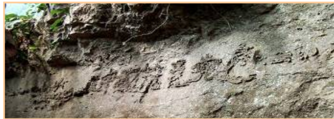
■图为贵州平塘县掌布风景区内的“藏字石”，被中科院地质专家鉴定为距今 2.7 亿年，500 年前从崖壁落下，石头断面上天然形成六个大字：中国共产党亡。

想想贵州藏字石天然形成，上面清楚显现着“中国共产党亡”六个大字，这难道不是天惩来临前的预兆吗？谁能说这不是神再一次给人机会呢？古语