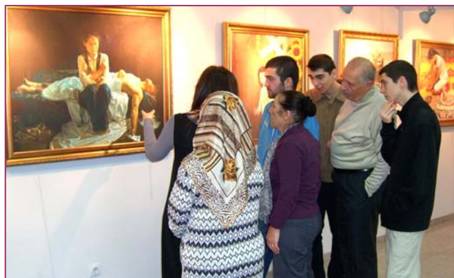
■ 观者们在专注聆听画作的详细解说

画展赢得不同阶层民众的高度评价，很多参观者久久不愿离开，有的观众在作品前潸然泪下。很多人表示，作品给他们留下了深刻的印象。人们在赞美法轮大法的同时，也谴责中共的暴行，表达对法轮大法（又称法轮功）的支持与同情，希望能尽早结束迫害。