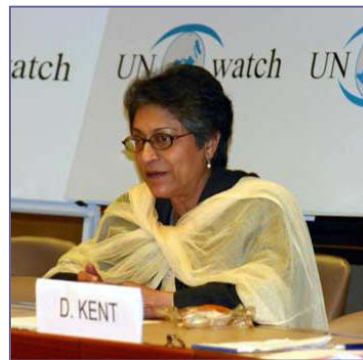
■ 联合国“宗教信仰自由”特派专员阿斯玛·贾汉吉尔

贾汉吉尔在报告中引用前任特派专员的话指出，“不能对1981年宣言中[译者注：即1981年11月25日通过的《消除基于宗教或信仰原因的一切形式的不容忍和歧视宣言》]涉及到的宗教活动予以干涉。在任何情况下都不能干涉信仰自由或强制信仰。”她强调：“1981年的宣言不仅仅是保障宗教，而且还有对于有神论信仰的保证。”