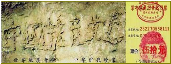
■ 贵州平塘县天然形成的藏字石，清楚显现“中国共产党亡”六个大字。至今有超过 7000 万的大陆民众，声明退党、退团、退队，选择美好未来。

但是只要您愿意去接触更多的信息，去读一读在大陆已经广泛流传的《九评共产党》，点击一下安全快捷的破网软件，您就会走出那堵红墙，看到那个本应该属于您的真实世界。