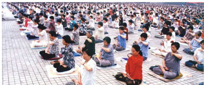
■ 1998年5月，沈阳万名法轮功学员集体炼功

目前法轮功已弘传世界一百多个国家，超过一亿人修炼。法轮功书籍被翻译成三十多种文字在全世界发行。