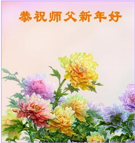
新年之际,世界各地法轮功学员通过明慧网传送上万份精美的贺词、贺卡,表达对师尊的无限感恩。

现在我的腿完全好了,一点疼痛也没有了。我不但能正常走路,脱光的头发也长出来了。我很快就要重返校园了!我想通过我的亲身经历,让全世界的人都知道,法轮大法是正法,是救人的大法。