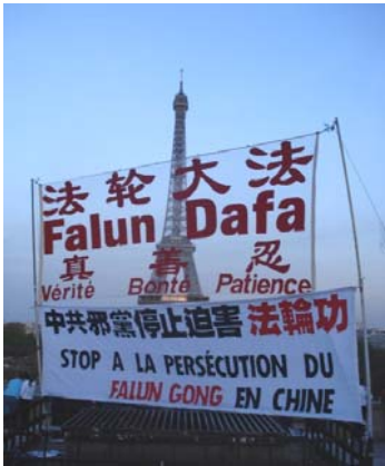
法国“退出中共服务中心”常年在巴黎著名景点——埃菲尔铁塔附近设立展板，播放广播，揭露中共迫害百姓的事实，劝说中国游客退出中共党、团组织（三退），每天都有数十至上百中国人在此办理三退手续。