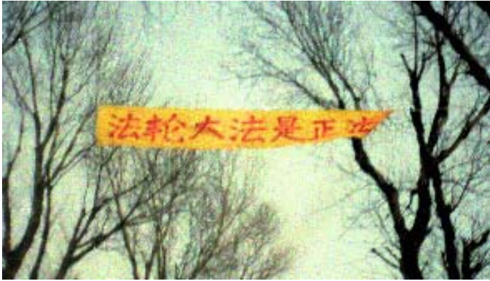
大陆法轮功学员将横幅挂在公路上帮助人们了解真相