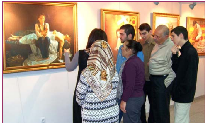
■ 观者们在专注聆听画作的详细解说

画展赢得不同阶层民众的高度评价，很多参观者久久不愿离开，有的观众在作品前潸然泪下。很多人表示，作品给他们留下了深刻的印象。人们在赞美法轮大法的同时，也谴责中共的暴行，表达对法轮大法（又称法轮功）的支持与同情，希望能尽早结束迫害。◇