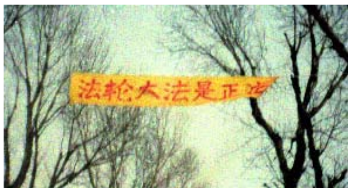
중국대륙의 길가에 걸려있는 프랑카드

금년 음력 초 8 일 저녁 해질무렵, 시드니시 중심거리에서 새해 꽃불대순회유람이