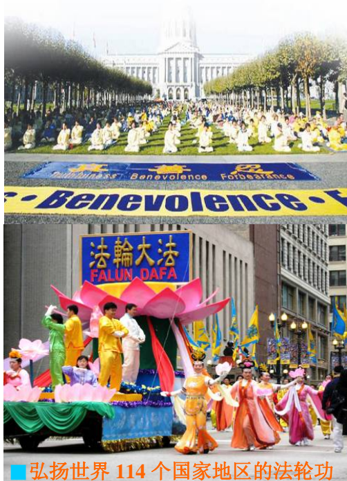
弘扬世界 114 个国家地区的法轮功

2009 年 5 月 13 日，第十届世界法轮大法日，加拿大总理斯蒂芬·哈珀代表个人和加拿大政府向法轮功学员表示祝贺，并对法轮功学员将法轮大法修炼和传统与公众分享的做法表示赞赏。◇