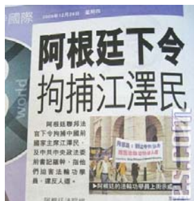
■ 2009年12月24日 香港《都市日报》有关审判江泽民等报道