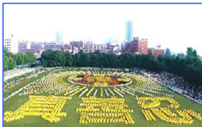
▲ 5000 多名武汉法轮功学员集体炼功,排组法轮图形和“真善忍”。(1997)

● 法轮大法至今已洪传世界 110 多个国家和地区,获得各国政府褒奖、支持议案、信函超过 3000 项。法轮大法的主要著作《转法轮》已被译成 30 多种文字,在全世界出版发行。