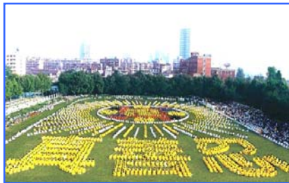
▲ 5000 多名武汉法轮功学员集体炼功,排组法轮图形和“真善忍”。(1997)

● 法轮大法至今已洪传世界 110 多个国家和地区,获得各国政府褒奖、支持议案、信函超过 3000 项。法轮大法的主要著作《转法轮》已被译成 30 多种文字,在全世界出版发行。