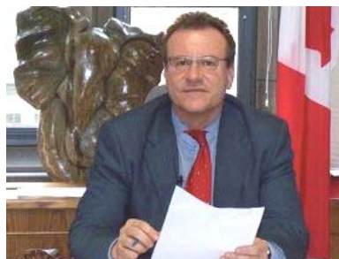
■加拿大国会议员瑞兹纽科斯基

加拿大“国会法轮功之友”副主席、国会议员博瑞·瑞兹纽科斯基（Borys Wrzesnewskyj）3 月 23 日在接受记者采访时谈了对 605 决议案的看法，他说：“迫害法轮功是一个根本不应该发生的恐怖事件，现在是世人发出声音的时候了，这也是这项决议案所做的。它记录着迫害发生了十年，也在呼吁具体的行动。例如，在第二条里，呼吁废除所谓的‘六一零办公室’。”