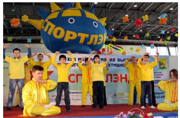
■ 莫斯科“第二十二届儿童体育王国博览会”上的法轮功功法演示

法轮功学员参加了博览会,介绍和表演法轮功功法,教小朋友们叠纸莲花。俄罗斯法轮大法中心因积极参与莫斯科市的社会项目和文体项目,获得博览会组委会颁发的两项褒奖,这是法轮功学员第三次在儿童博览会上获奖。◇