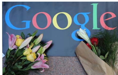
图：2010年1月14日，民众向谷歌献花，表达对谷歌不向中共叩首的支持。

可以看出，这些年中共封网封得最厉害的，就是法轮功真相。很明显，修炼“真善忍”的法轮功学员对哪个社会都是有百利而