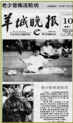
左上：1998 年北京法轮功学员晨炼。这样的炼功场面 1999 年 7 月前在中国城市乡村随处可见。