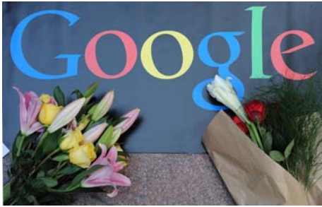
图：2010年1月14日，民众向谷歌献花，表达对谷歌不向中共叩首的支持。

为什么会这样呢？大家知道，接受什么样的信息基本上就决定了人们的思维走向。因为中共的宣传部控制着什么能说，什么不能说，所以，在中国的读者能看到的東西都是比较统一口径的，是被中共按照自己的意识形态和如何有利于维护统治地位扭曲加工过的。这种不完整、甚至虚假的信息带给人的危害，有时比什么都不知道还可怕。