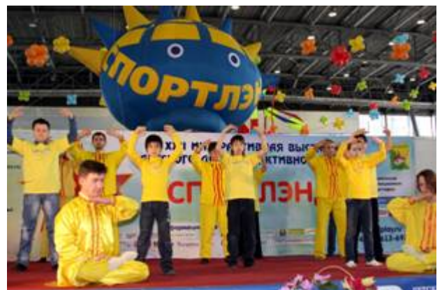
■ 莫斯科“第二十二届儿童体育王国博览会”上的法轮功功法演示

法轮功学员参加了博览会，介绍和表演法轮功功法，教小朋友们叠纸莲花。俄罗斯法轮大法中心因积极参与莫斯科市的社会项目和文体项目，获得博览会组委会颁发的两项褒奖，这是法轮功学员第三次在儿童博览会上获奖。◇