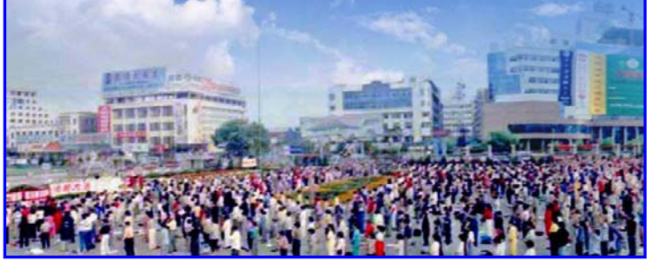
牡丹江大法弟子在文化宫广场集体炼功

小资料: 1999 年 7 月 20 日, 以江泽民为首的中共集团发动了对法轮功的全面迫害, 十年来至少 6000 人被非法判刑, 超过 10 万人被非法劳教, 数千人被强迫送入精神病院, 中共用于洗脑的酷刑有上百种。已知有 3369 名法轮功学员被迫害致死(至 2010 年 4 月初)。还有无法统计的众多法轮功学员被秘密活体摘取器官。◇