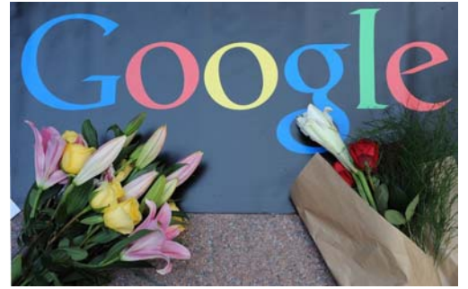
图：2010 年 1 月 14 日，民众向谷歌献花，表达对谷歌不向中共叩首的支持。

可以看出，这些年中共封网封得最厉害的，就是法轮功真相。很明显，修炼“真善忍”的法轮功学员对哪个社会都是有百利而