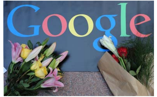
图：2010 年 1 月 14 日，民众向谷歌献花，表达对谷歌不向中共叩首的支持。

可以看出，这些年中中共封网封得最厉害的，就是法轮功真相。很明显，修炼“真善忍”的法轮功学员对哪个社会都是有百利而