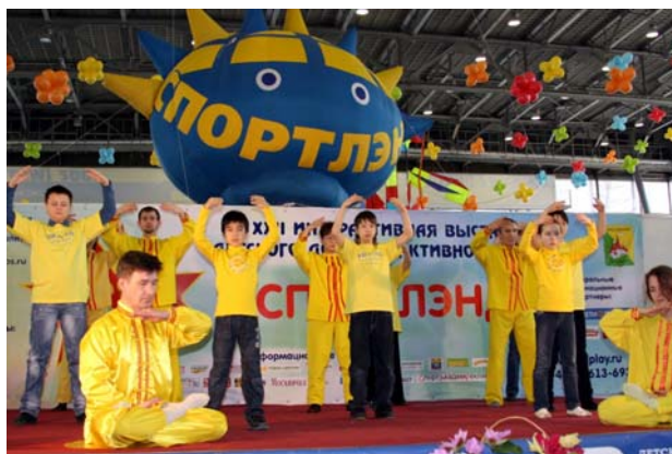
■ 莫斯科“第二十二届儿童体育王国博览会”上的法轮功功法演示

法轮功学员参加了博览会,介绍和表演法轮功功法,教小朋友们叠纸莲花。俄罗斯法轮大法中心因积极参与莫斯科市的社会项目和文体项目,获得博览会组委会颁发的两项褒奖,这是法轮功学员第三次在儿童博览会上获奖。◇