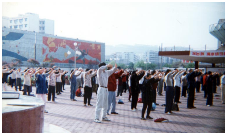
■ 1998 年重庆法轮功学员周末集体炼功

2009 年 10 月 27 日下午，陈银汝在新区赛格电子市场发真相资料时再次遭恶警绑架，并被非法抄家，掠走笔记本等物品。恶警还去单位骚扰。10 月 28 日凌晨 5 时，