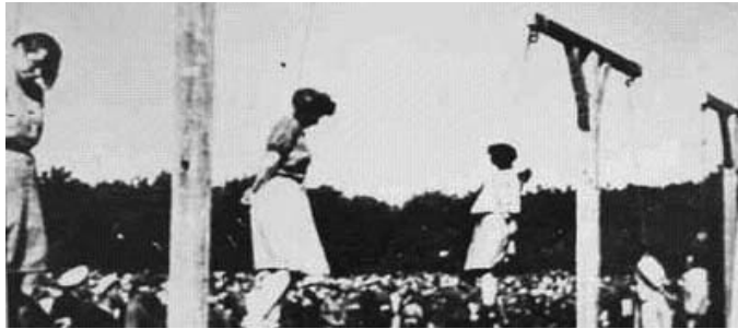
图：纽伦堡国际战犯法庭经过对纳粹集中营死亡护士组在对犹太人的种族灭绝中所犯罪行的认定，于1946年对她们执行死（绞）刑。

近来我在网络上也看到了一组历史照片，说的是1946年，纽伦堡国际战犯法庭执行对纳粹集中营死亡护士组的死刑。这位已经加入美国国籍的前党卫军成员和纳粹集中营死亡护士组的成员，在对犹太人的种族灭绝中自愿成为纳粹杀人机器的一部分。这些纳粹分子助纣为虐，都是希特勒叫干的，但是他们并没有因为是希特勒叫他们干的而能够逃避责任。