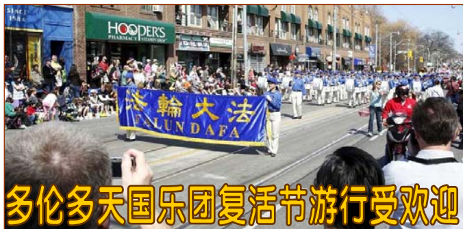
多伦多天国乐团复活节游行受欢迎

新泽西州国会议员克里斯·史密斯说：我强烈支持旨在保护遭受中共残酷迫害的法轮功学员人权的众议院第605号决议案，也感谢我的好朋友罗斯·雷婷恩女士提出这一决议案。法轮功学员的遭