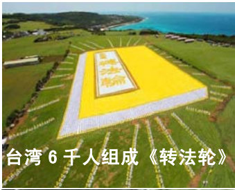
台湾 6 千人组成《转法轮》