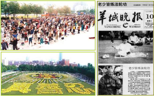
左上：1998 年北京法轮功学员晨炼。这样的炼功场面 1999 年 7 月前在中国城市乡村随处可见。 左下：1997 年武汉 5000 多法轮功学员炼功组字。 右：《羊城晚报》报道《老少皆炼法轮功》（1998.11.10）

法轮功是一门修炼的功法，法理中涉及到无神论以外的因素，这成为中共不能容忍的理由之一。