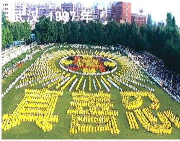
武汉 1997 年

从西医的角度看，疾病是由病菌、病毒等病源所致；中医则认为是由风、火、暑、湿、燥、寒等外因引起。西医对病理的探究还局限在物质表层，中医则更注重病的起因，已涉及到较深层的理。而修炼者在大法修炼中能看到更深层、更微观、更本质——人得病的根源，是人做了不好的事所致。如