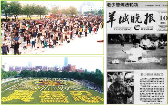
左上：1998 年北京法轮功学员晨炼。这样的炼功场面 1999 年 7 月前在中国城市乡村随处可见。 左下：1997 年武汉 5000 多法轮功学员炼功组字。 右：《羊城晚报》报道《老少皆炼法轮功》（1998.11.10）

法轮功是一门修炼的功法，法理中涉及到无神论以外的因素，这成为中共不能容忍的理由之一。