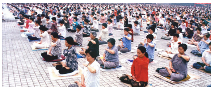
1998 年 5 月, 沈阳万名法轮功学员集体炼功