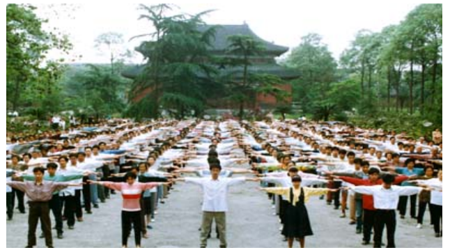
1999 年 7.20 迫害以前成都法轮功学员集体炼功