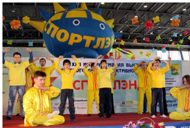
■ 莫斯科“第二十二届儿童体育王国博览会”上的法轮功功法演示

法轮功学员参加了博览会,介绍和表演法轮功功法,教小朋友们叠纸莲花。俄罗斯法轮大法中心因积极参与莫斯科市的社会项目和文体项目,获得博览会组委会颁发的两项褒奖,这是法轮功学员第三次在儿童博览会上获奖。◇