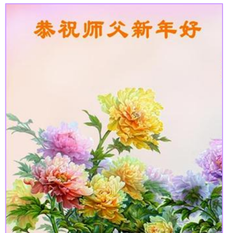
新年之际，世界各地法轮功学员通过明慧网传送上万份精美的贺词、贺卡，表达对师尊的无限感恩。

现在我的腿完全好了，一点疼痛也没有了。我不但能正常走路，脱光的头发也长出来了。我很快就要重返校园了！我想通过我的亲身经历，让全世界的人都知道，法轮大法是正法，是救人的大法。