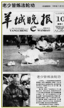
左上：1998 年北京法轮功学员晨炼。这样的炼功场面 1999 年 7 月前在中国城市乡村随处可见。 左下：1997 年武汉 5000 多法轮功学员炼功组字。 右：《羊城晚报》报道《老少皆炼法轮功》（1998.11.10）