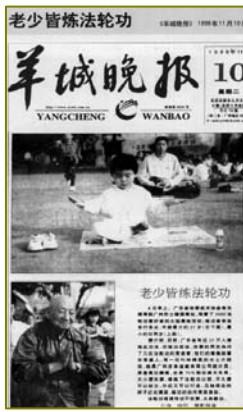
左上：1998 年北京法轮功学员晨炼。这样的炼功场面 1999 年 7 月前在中国城市乡村随处可见。 左下：1997 年武汉 5000 多法轮功学员炼功组字。 右：《羊城晚报》报道《老少皆炼法轮功》（1998.11.10）