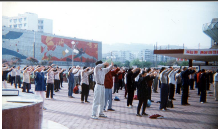
■ 1998 年重庆法轮功学员周末集体炼功