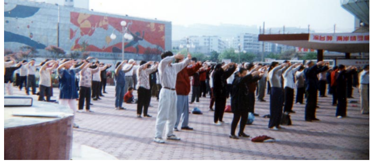
■1998 年重庆法轮功学员周末集体炼功

地骚扰、非法关押、折磨,但都没改变老人对信仰的坚定。气急败坏的中共官员偷偷摸摸地暗地里就将这个六十岁的老人非法劳教,所谓的依据就是因“炼法轮功身体变好了”。这可真是世界上独一无二的具有中国特色的“犯罪证据”啊!◇