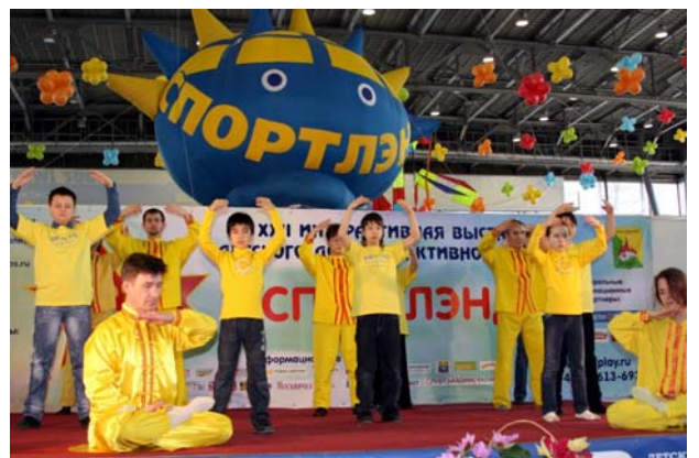
■ 莫斯科“第二十二届儿童体育王国博览会”上的法轮功功法演示

法轮功学员参加了博览会, 介绍和表演法轮功功法, 教小朋友们叠纸莲花。俄罗斯法轮大法中心因积极参与莫斯科市的社会项目和文体项目, 获得博览会组委会颁发的两项褒奖, 这是法轮功学员第三次在儿童博览会上获奖。◇