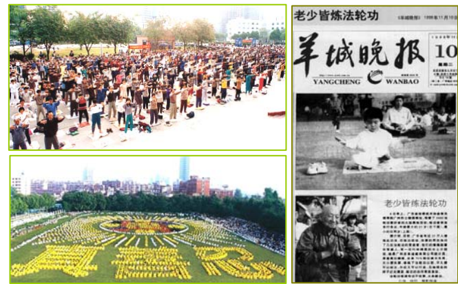
左上：1998 年北京法轮功学员晨炼。这样的炼功场面 1999 年 7 月前在中国城市乡村随处可见。 左下：1997 年武汉 5000 多法轮功学员炼功组字。 右：《羊城晚报》报道《老少皆炼法轮功》（1998.11.10）