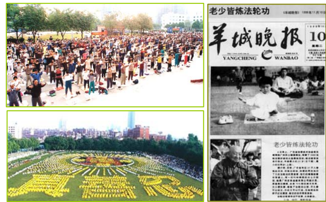
左上：1998 年北京法轮功学员晨炼。这样的炼功场面 1999 年 7 月前在中国城市乡村随处可见。 左下：1997 年武汉 5000 多法轮功学员炼功组字。 右：《羊城晚报》报道《老少皆炼法轮功》（1998.11.10）

法轮功传出之后，因为其独特的祛病健身奇效和在道德上的高标准要求，很快引起世人及媒体的广泛关注。《中国青年报》、《北京日报》、《中国经济时报》、《羊城晚报》及部份省市的电台、电视台对法轮功都作了正面的报道。1998 年 5 月 15 日中央电视台第一套节目《晚间新闻》和第五套节目中分别报道了国家体育总局伍绍祖局长视察长春时，广大群众修炼法轮功的盛况。