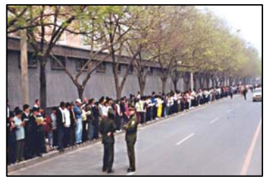
■“四二五”上访的法轮功学员文明安静，警察不用维持秩序，在一旁聊天。所谓的围攻中南海根本不存在。