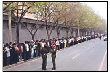
■“四二五”上访的法轮功学员文明安静，警察不用维持秩序，在一旁聊天。所谓的围攻中南海根本不存在。

意造成的法轮功学员“围攻中南海”的假相。站在法轮功一方来说，去的目的就一个，就是想向中央反映对法轮功的不公对待，让中共领导人看一看法轮功究竟是一个什么样的群体。