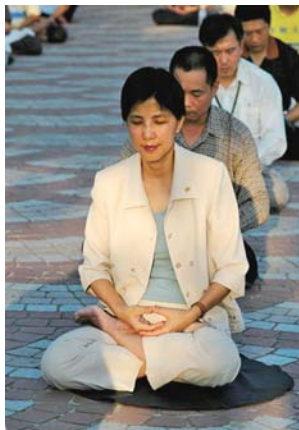
■台湾大学新闻所教授 张锦华