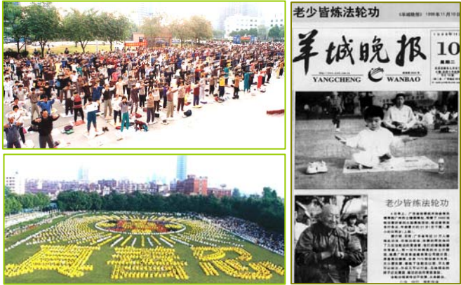
左上：1998 年北京法轮功学员晨炼。这样的炼功场面 1999 年 7 月前在中国城市乡村随处可见。