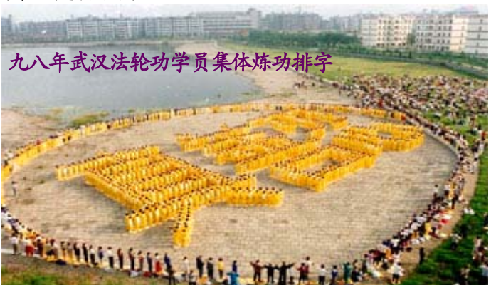
九八年武汉法轮功学员集体炼功排字

“宪法”第三十五条规定，中华人民共和国公民有言论、出版、集会、结社、游行、示威的自由。信仰者拥有文字载体是正常的事，法轮功学员告诉人们法轮功真相，制作、散发真相资料，完全是法律允许范围内的，是合法的。◇