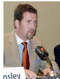
■ 加拿大国会议员斯考特·瑞德