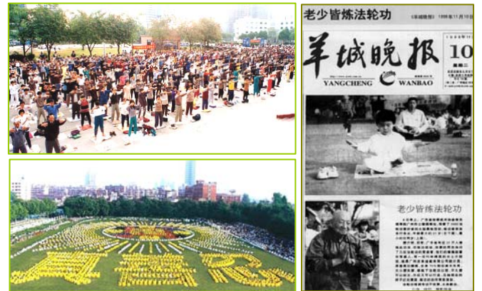
左上：1998 年北京法轮功学员晨炼。这样的炼功场面 1999 年 7 月前在中国城市乡村随处可见。 左下：1997 年武汉 5000 多法轮功学员炼功组字。 右：《羊城晚报》报道《老少皆炼法轮功》（1998.11.10）

广泛关注。《中国青年报》、《北京日报》、《中国经济时报》、《羊城晚报》及部份省市的电台、电视台对法轮功都作了正面的报道。1998 年 5 月 15 日中央电视台第一套节目《晚间新闻》和第五套节目中分别报道了国家体育总局伍绍祖局长视察长春时，广大群众修炼法轮功的盛况。