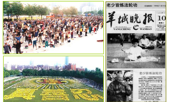
左上：1998 年北京法轮功学员晨炼。这样的炼功场面 1999 年 7 月前在中国城市乡村随处可见。 左下：1997 年武汉 5000 多法轮功学员炼功组字。 右：《羊城晚报》报道《老少皆炼法轮功》（1998.11.10）

广泛关注。《中国青年报》、《北京日报》、《中国经济时报》、《羊城晚报》及部份省市的电台、电视台对法轮功都作了正面的报道。1998 年 5 月 15 日中央电视台第一套节目《晚间新闻》和第五套节目中分别报道了国家体育总局伍绍祖局长视察长春时，广大群众修炼法轮功的盛况。