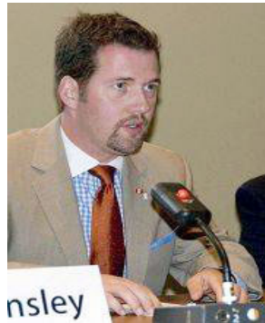
■加拿大国会议员斯考特瑞德

瑞德强调：“这是一个很强的信号，就象在加拿大一样，‘停止迫害法轮功，中国要尊重人权’在美国也是一个共识。”