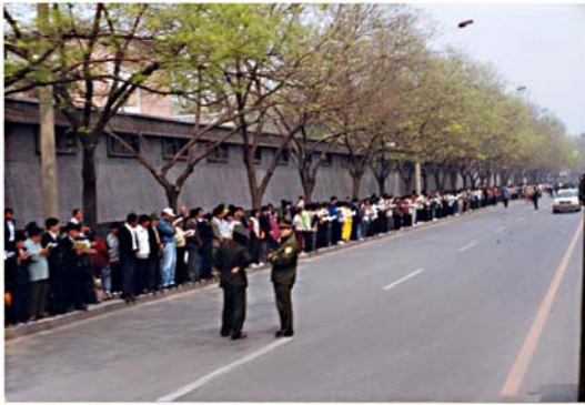
■ “4·25”现场，法轮功学员文明安静