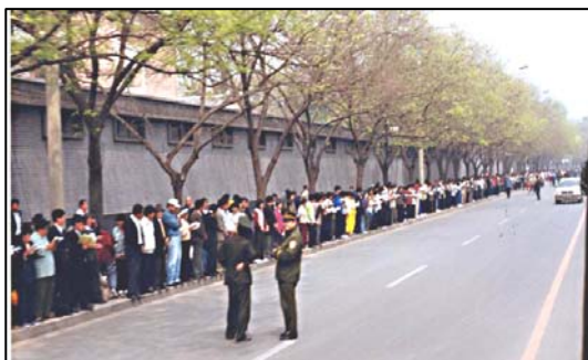
■这就是被邪党诽谤成围攻中南海的 4.25 万名法轮功学员和平理性上访的现场照片, 法轮功学员在警察引领下, 秩序井然, 静静等候, 警察在旁边闲聊着。

打和非法逮捕法轮功学员, 致学员流血受伤, 四十五人被抓。学员在天津市政府被告知: 公安部介入了这个事件, 你们去北京才能解决问题。