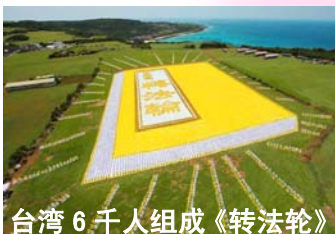
台湾6千人组成《转法轮》

法轮大法已弘传世界114个国家和地区，受到世界人民的爱戴和尊敬。李洪志先生和法轮大法对人类身心健康作出的杰出贡献，获得各国政府褒奖、支持议案信函超过三千多项。法轮功书籍被译成30多种语言在世界各国出版发行。2000年起，李洪志先生连续四年被提名诺贝尔和平奖。