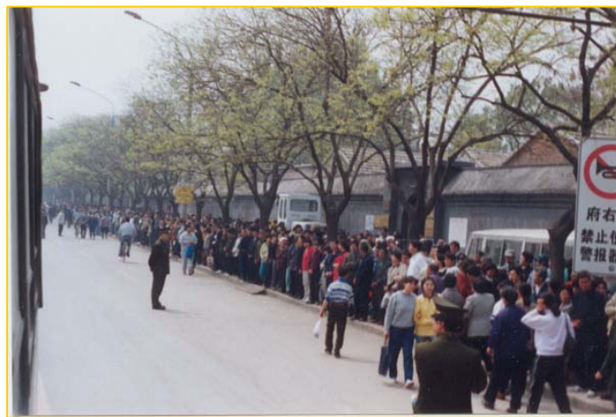
■ 1999 年 4 月 25 日, 上访的法轮功学员静静等待着向国务院信访办反映情况